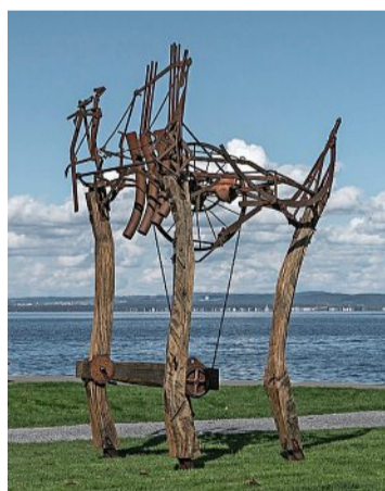
Werk «Klangmechanik».

Sein erstes Atelier betrieb er in der Felsenau, später zügelte er nach Kehrsatz. Dort musste er zugunsten eines gemeinschaftlichen Wohnbauprojekts weichen. «Wenn man einen Ort verlassen muss, in den man viel investiert hat, tut das weh.» Doch das Nachfolgeprojekt ge-